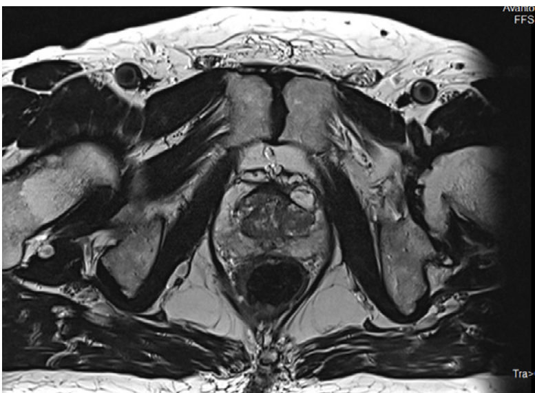
NORAS Uni-Belt 16-Kanal Diagnostik- &amp; Interventionsspule